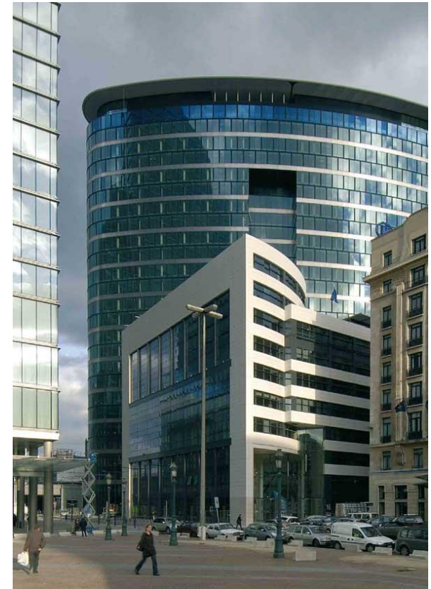
Covet garden, Bruselas